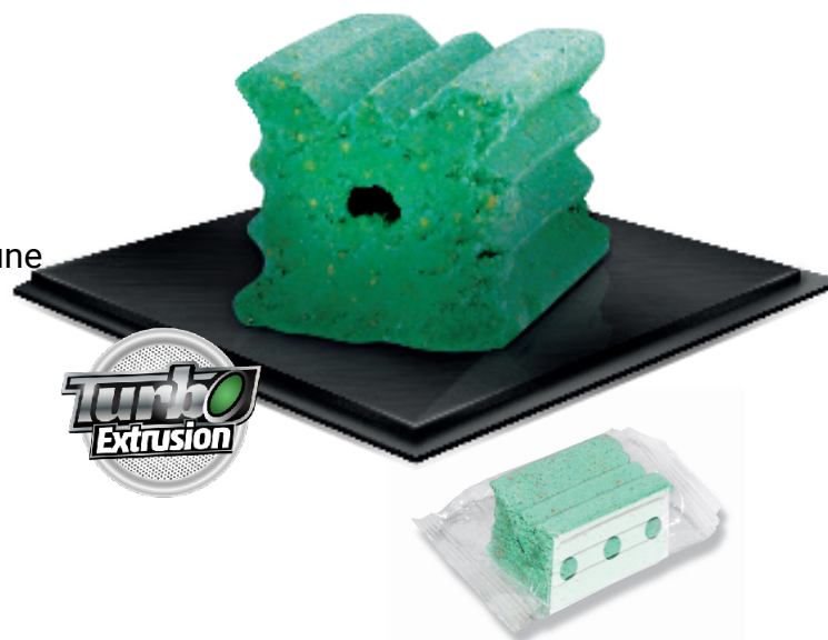
Film perforé 25g

Très résistant à l'humidité, aux moisissures. Bloc emballé pour une résistance maximale.